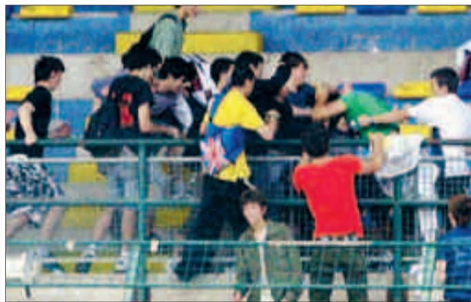
La rissa scoppiata in tribuna al Briamasco